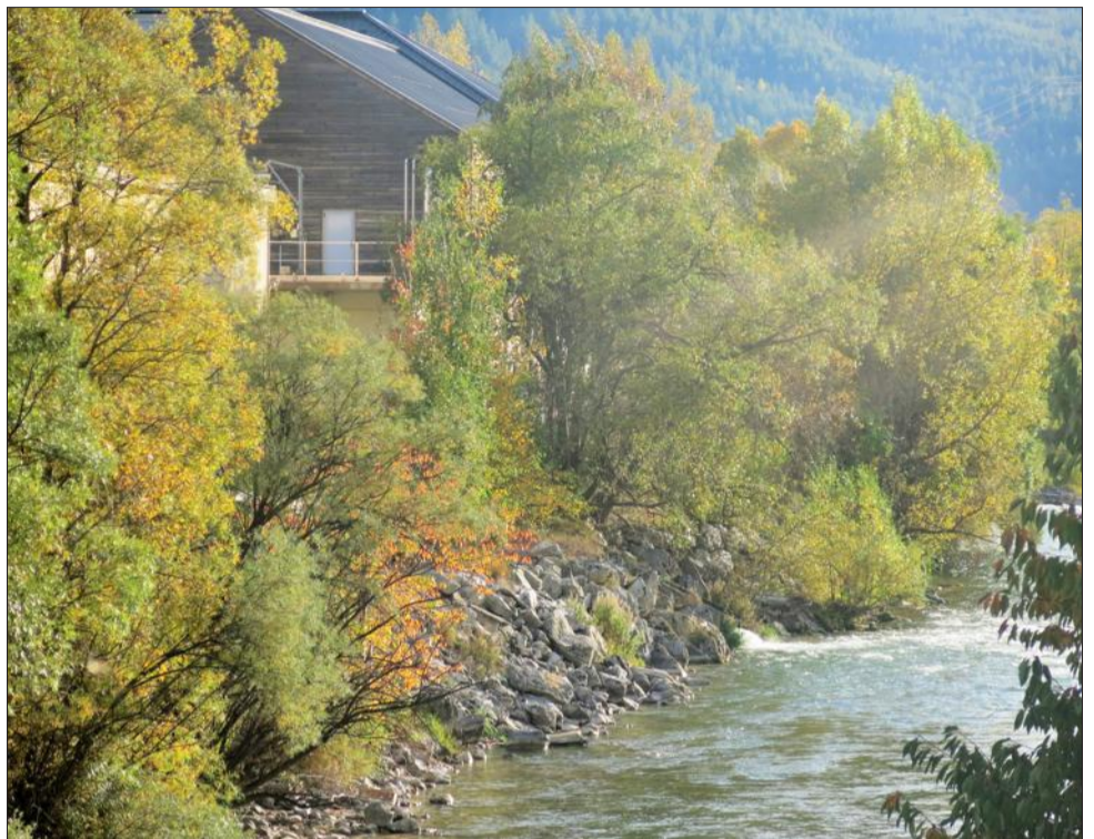
La communauté de communes du Briançonnais et l'association Eau-Secours-Briançonnais révèlent des dysfonctionnements dans le traitement des eaux usées mais Suez nie.